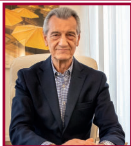
Giorgio Galvagno Presidente

Carissimi Azionisti, è questa la prima volta che ho l'occasione