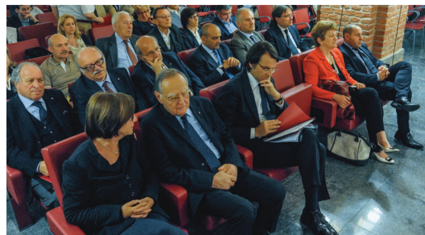
Momenti dell'Assemblea Straordinaria dei Soci di giovedì 28 maggio 2015.

Messaggio pubblicitario con finalità promozionali. Prima dell'adesione leggere il prospetto informativo e valutare i rischi connessi all'investimento. Il prospetto informativo è disponibile gratuitamente presso la sede legale e presso tutte le filiali di Banca di Asti e Biver Banca, nonché su www.bancadiasti.it e www.biverbanca.it .