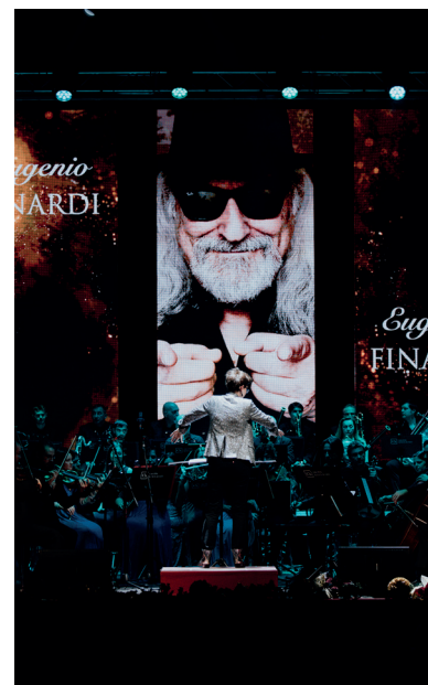
Immagini tratte dall'edizione 2023 del Concerto di Natale

Il 2024 si è rivelato un anno denso di soddisfazioni per la nostra Banca, con risultati positivi frutto di un impegno condiviso e di una strategia solida, costruita giorno dopo giorno, sempre orientata a un consolidamento patrimoniale, al miglioramento