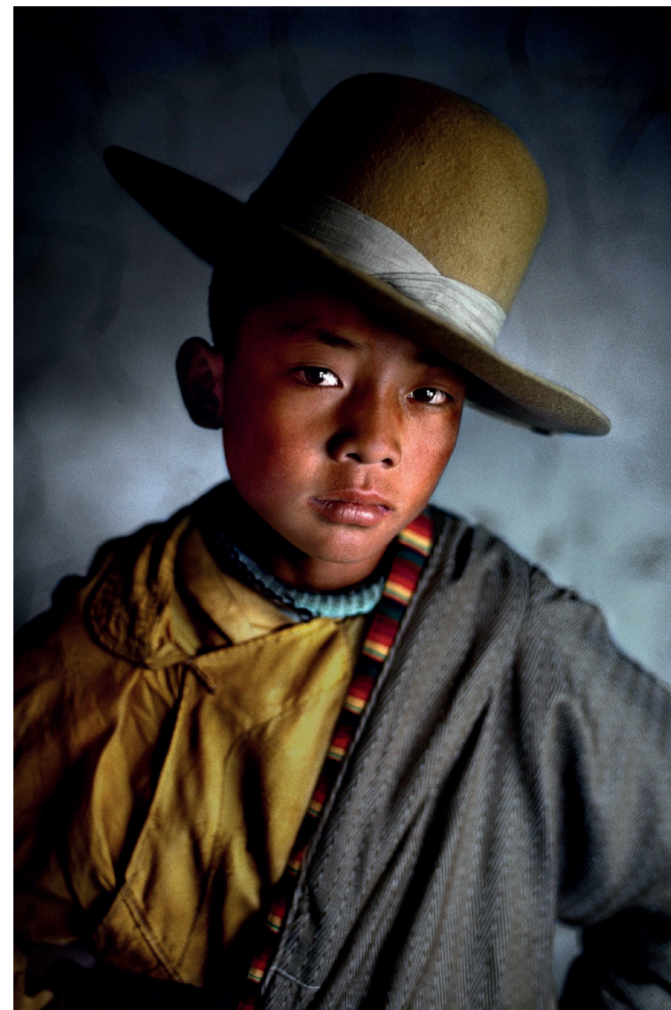
Steve McCurry, Litang , Tibet, 2000 - Fotografia

Corso del Piazza, 29 13900 - Biella (BI) www.palazzoferrero.it