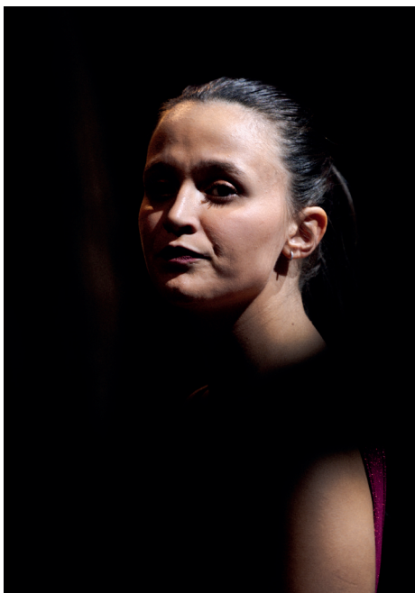
Immagini tratte dall'edizione 2023 del Concerto di Natale

Concludiamo rivolgendo a ciascuno di voi i più sinceri auguri per una felice conclusione di quest'anno e per un 2025 ricco di nuove opportunità, traguardi e soddisfazioni.